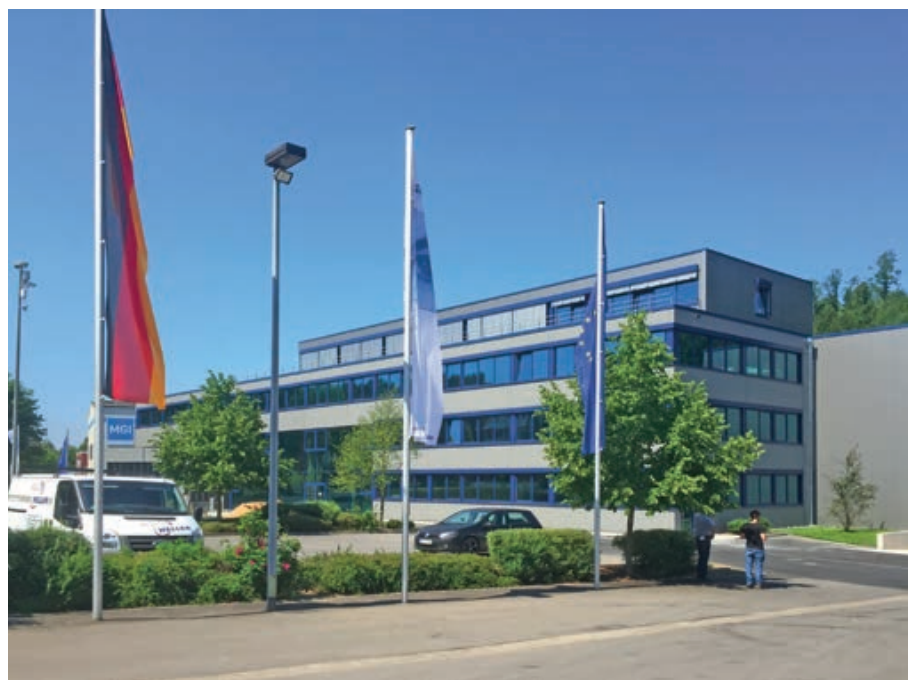
Neubau einer Lagerhalle mit Verwaltung der Firma Heinrich Schulte & Sohn GmbH & Co. KG in Olpe.