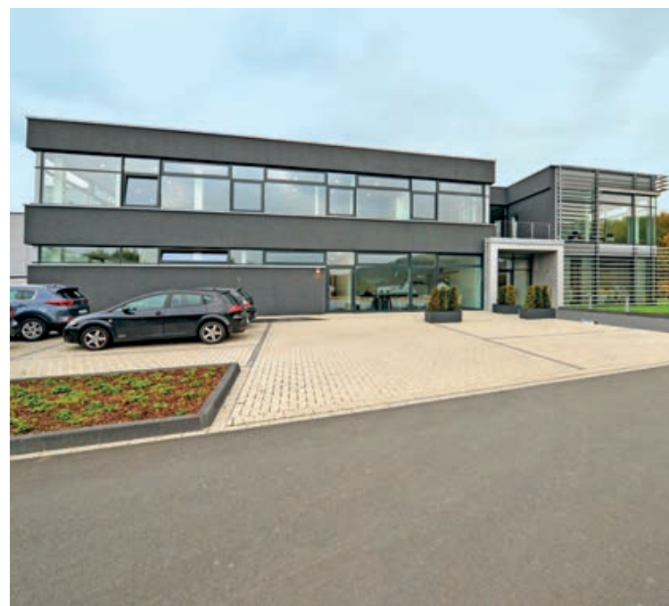
Neubau einer Produktionshalle mit Verwaltung der Markes GmbH & Co. KG in Halver